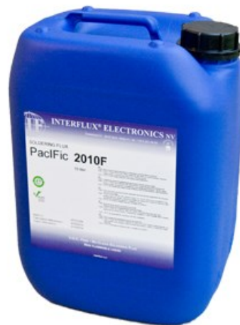
Abgebildetes Produkt kann vom gelieferten Produkt abweichen