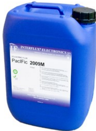
La photo n'est pas contractuelle

Vous pouvez changer le flux à base d'alcool au profit du flux à base d'eau virtuellement sans désavantage.