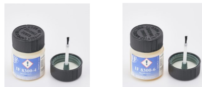
La photo n'est pas contractuelle